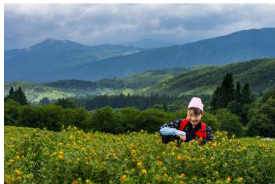
第28回 グランプリ作品「紅花娘」