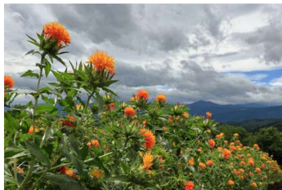
第28回 特選作品「天空の花畑」